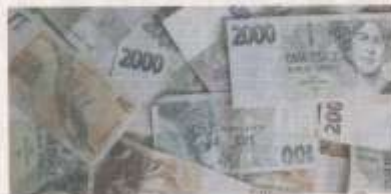
Zastřežení foto Deník

studenti sezení a prověřit si ji, když si sami něco připraví a rozhodli si začít až do konca. Tak tomu bylo i ve společenských vědách gymnázia Komenského v Havířově.