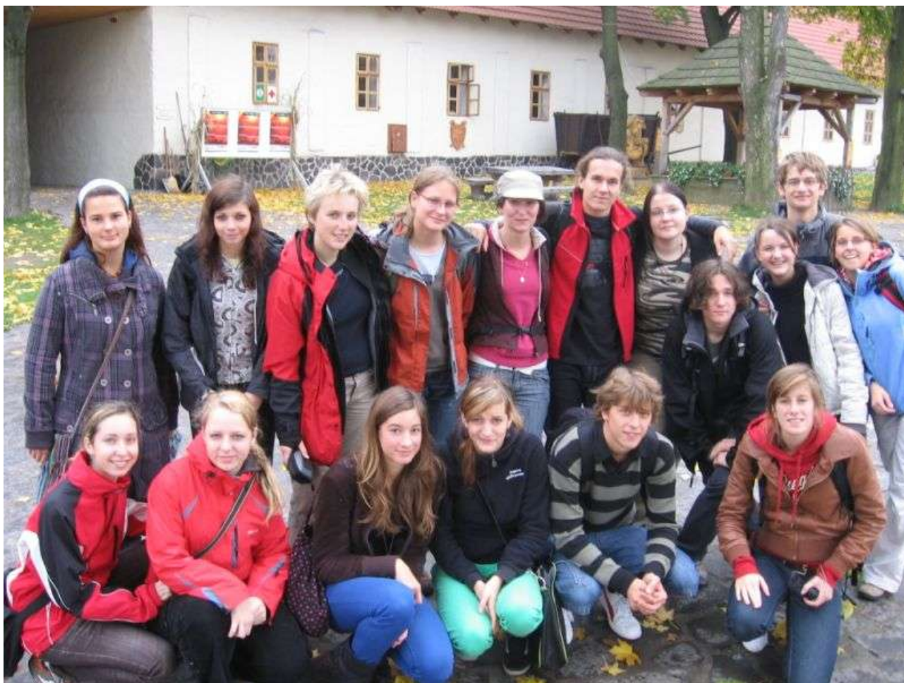
Projekt Comenius - Move2health - partnerská schůzka v Havířově - říjen 2008