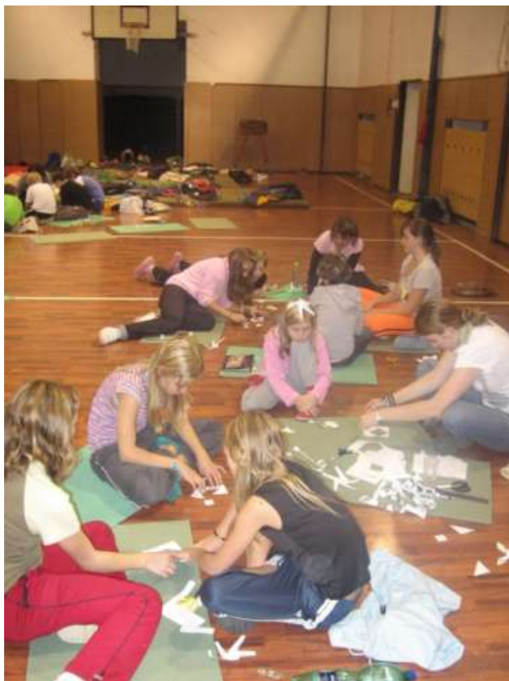
Debrujáři - Noc ve škole - říjen 2008